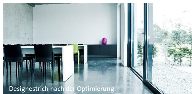
Designstrich nach der Optimierung.