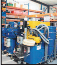
Dieses Lager ist praktisch die Keimzelle des Unternehmens.